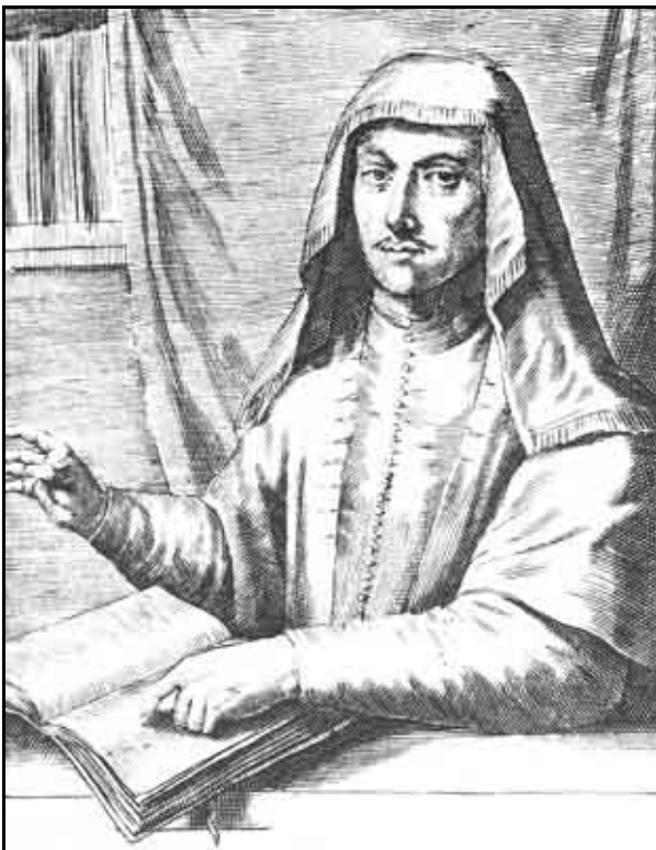
Wahres Portrait von Nathan von Gaza, gezeichnet von einem Augenzeugen in Smyrna, 1667. Aus: Thomas Coenen, Ydele Verwachtinge der Joden... (Amsterdam, 1669)