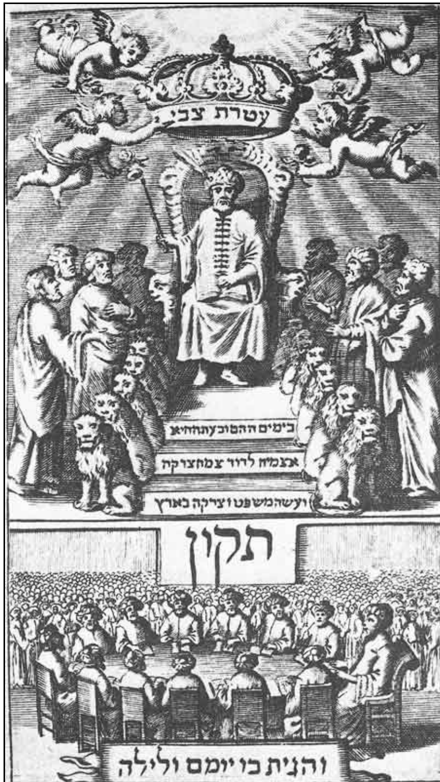
Sabatai Sevi als Messias, sitzend auf dem königlichen Thron, unter einer himmlischen Krone, die von Engeln gehalten wird und die Inschrift trägt: "Krone von Sevi." Unten: die Zehn Stämme beim Studieren der Thora mit dem Messias. Nach einem Kupferstich auf der Titelseite einer der Ausgaben von Nathans Tiqqun Qeri'ah (Amsterdam 1669)